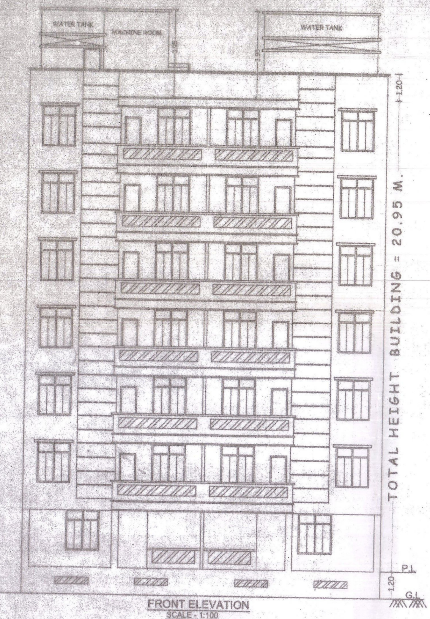
FRONT ELEVATION SCALE - 1:100