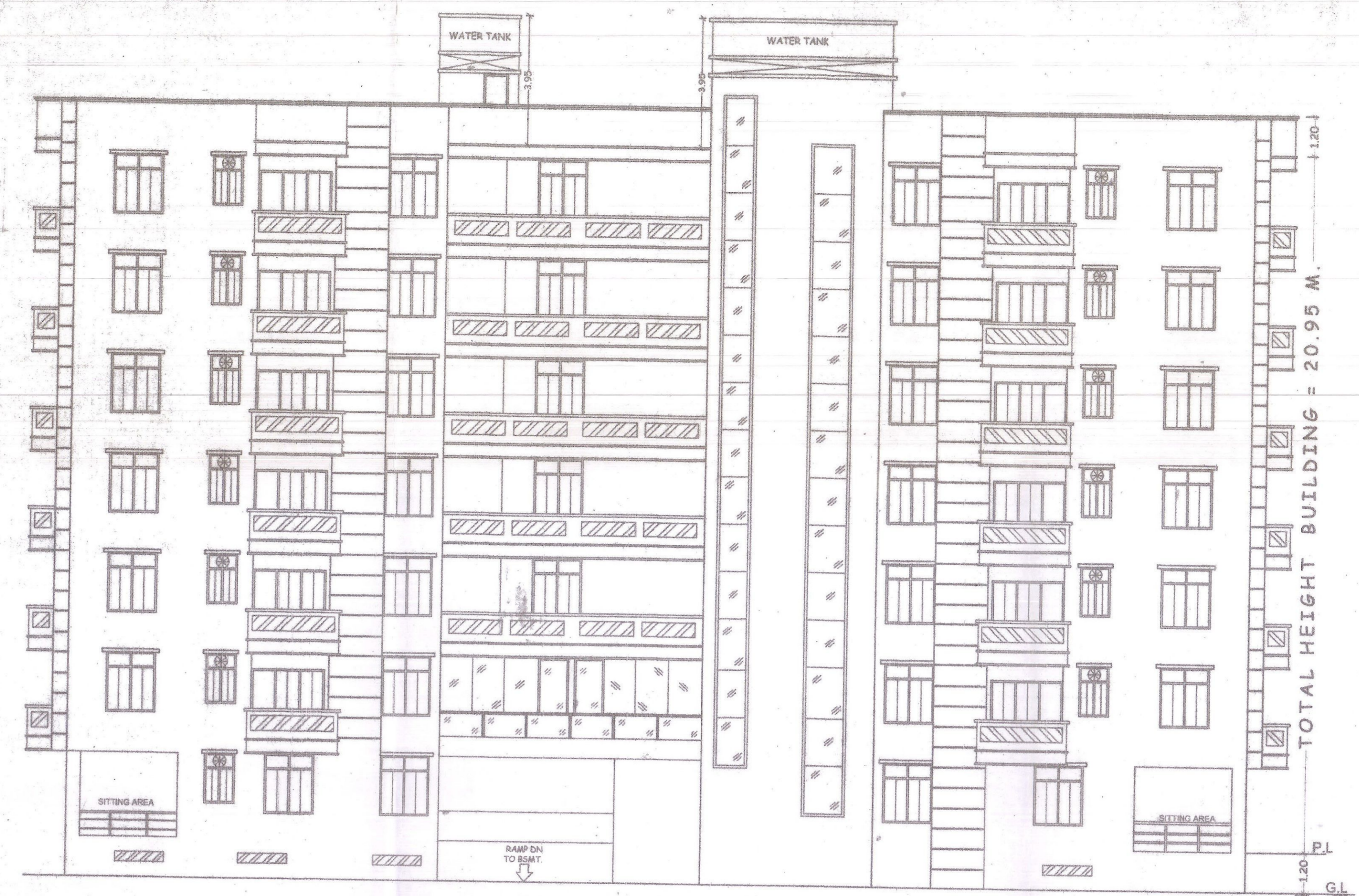
SIDE ELEVATION SCALE - 1:100