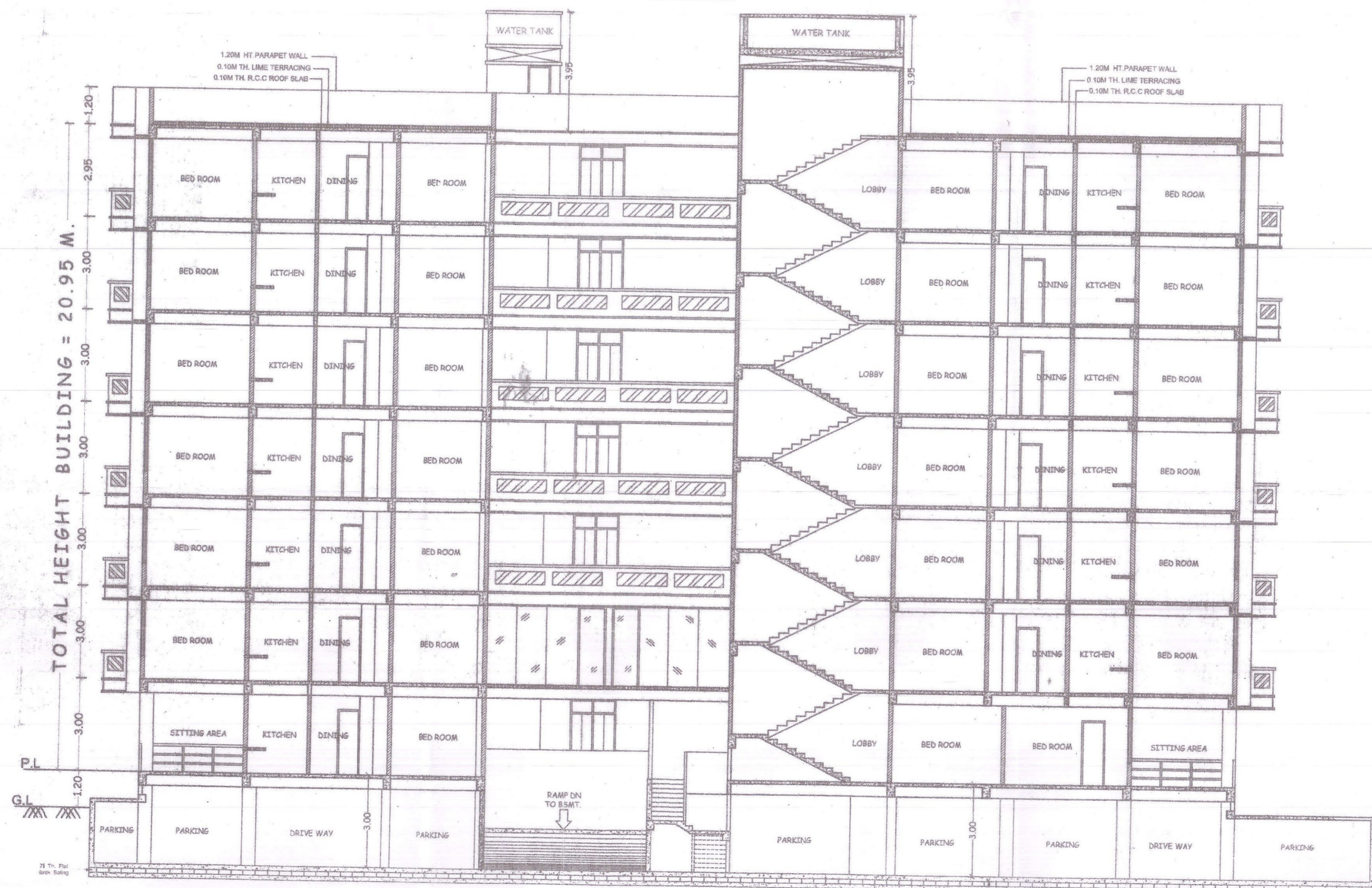
SECTION - YY SCALE - 1:100

RAIN WATER HARVESTING CALCULATION TOTAL PLOT AREA = 1336.53M 2 RECHARGE PIT CAPACITY @ 6M 3 FOR 100M 2 SO, 1336.53M 2 REQUIRED RECHARGE PIT AREA = 13.36 X 6 = 80.19M 3 RECHARGE PIT SIZE PROVIDED = 9.00X3.00X3.50 = 94.50M 3